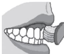
E = surfaces extérieures